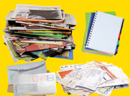
journaux, magazines, publicités, enveloppes, courriers, cahiers...*