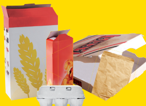
cartonnettes et papier kraft