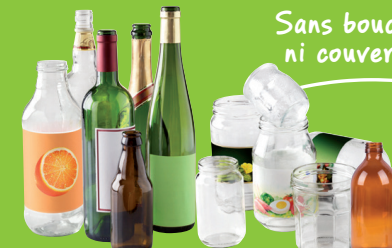
bouteilles, bocaux et flacons en verre