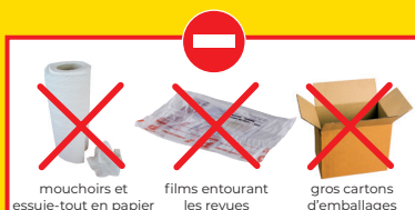
mouchoirs et essuie-tout en papier