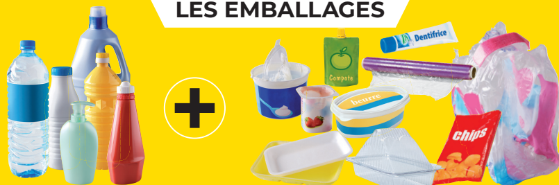
bouteilles et flacons en plastique