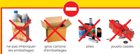
ne pas imbriquer les emballages